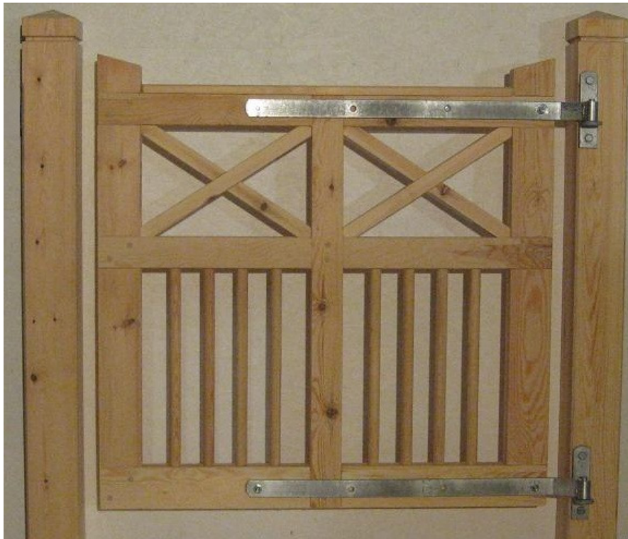
Alt. 1 (Öppnas endast in mot huset)

Börja med att mäta ut vilken höjd du vill ha grinden monterad på och vilka luftspalter du vill ha. En spalt mellan stolpe och grind på 50 mm är lagom med detta monterings sätt. Montera då kanten på fästena alldeles intill fasen på stolpen. Se till att fästena monteras exakt i våg på stolpen. Använd vattenpass. Förborra med skruv 6mm och dra fast med medföljande träskruv. Du kan sedan hänga på skenorna och sedan tillfälligt sätta upp grinden på rätt plats genom att använda tvingar mot skenorna eller att ställa grinden mot en regel på marken som är i våg. När du är nöjd med alla mått så borrar du igenom grinden vid hålen i skenorna och monterar fast den med medföljande vagnsbult. Nu ska grinden vara helt i våg och öppnas lätt. Med detta monterings sätt öppnas grinden med stor vinkel åt ena hållet, medan den knappt går att öppna alls åt andra hållet. Om du tvunget måste kunna öppna grinden åt båda hållen kan du montera dessa gångjärn mot insidan av stolpen. På grund av bocken på gångjärnet blir det dock en stor spalt mellan grind och stolpe på detta vis och är därför inte att föredra.