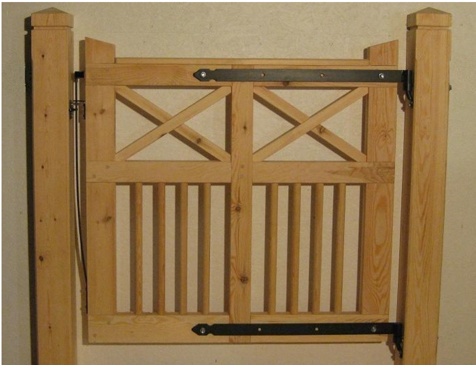
Alt. 2 (Svart lackerade för invändigt montage)

Om du behöver justera grinden för att den inte är riktigt i våg efter montage kan du antingen schimsa upp med ett par brickor under det ena fästet eller ta ur lite material med ett stämjärn bakom det andra fästet. Denna montering gör att grinden inte går att öppna fullt lika mycket som enligt alt. 1, däremot möjliggörs en liten öppningsvinkel även åt andra hållet.